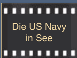
Die US Navy in See