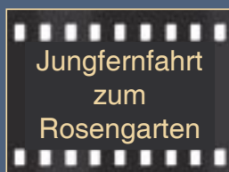
Jungfernfahrt zum Rosengarten