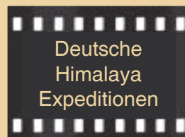
Deutsche Himalaya Expeditionen