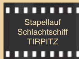
Stapellauf Schlachtschiff TIRPITZ