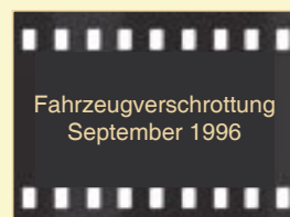
Fahrzeugverschrottung September 1996