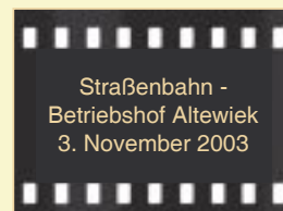
Straßenbahn - Betriebshof Altewiek 3. November 2003