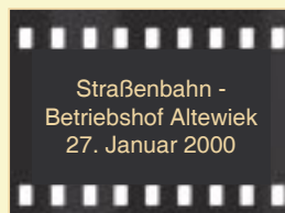
Straßenbahn - Betriebshof Altewiek 27. Januar 2000