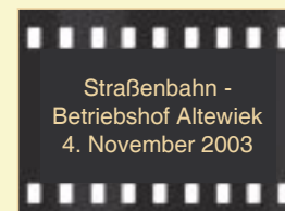
Straßenbahn - Betriebshof Altewiek 4. November 2003