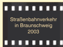
Straßenbahnverkehr in Braunschweig 2003