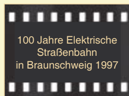
100 Jahre Elektrische Straßenbahn in Braunschweig 1997