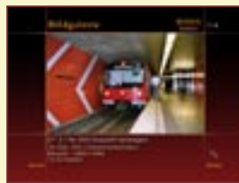
Bildgalerie DT 2