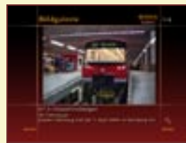
Bildgalerie DT 3