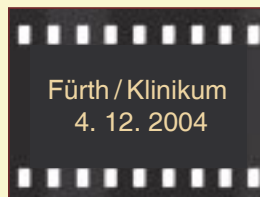
Fürth / Klinikum 4. 12. 2004