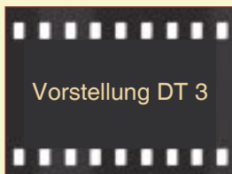
Vorstellung DT 3