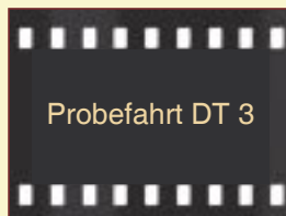
Probefahrt DT 3