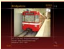
Bildgalerie DT 1