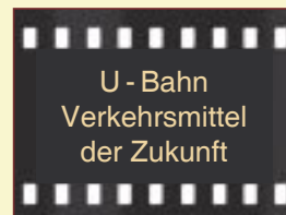
U - Bahn Verkehrsmittel der Zukunft