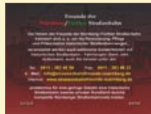
Freunde der Nürnberg / Fürther Straßenbahn