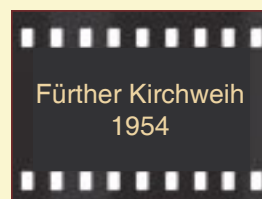
FÜRTH KIRCHWEI 1954