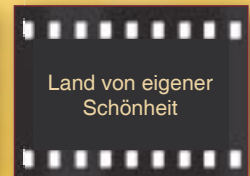
Land von eigener Schönheit