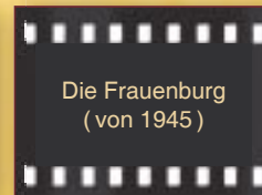
Die Frauenburg (von 1945)