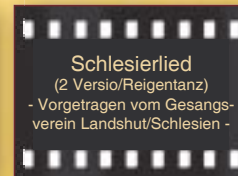
Schlesierlied (2. Versio/Reigentanz) - Vorgetragen vom Gesangs- verein Landshut/Schlesien -