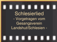
Schlesierlied - Vorgetragen vom Gesangsverein Landshut/Schlesien -