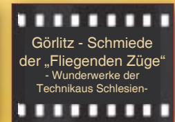
Görlitz - Schmiede der „Fliegenden Züge“ - Wunderwerke der Technikaus Schlesien -