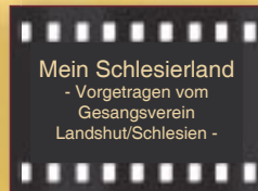
Mein Schlesierland - Vorgetragen vom Gesangsverein Landshut/Schlesien -