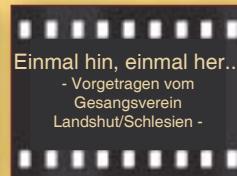
Einmal hin, einmal her... - Vorgetragen vom Gesangsverein Landshut/Schlesien -