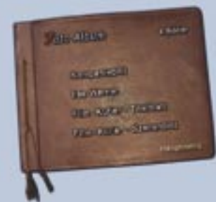
Foto Album mit themenbezogenen Abbildungen