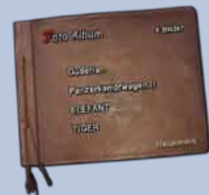
Foto Album mit themenbezogenen Abbildungen