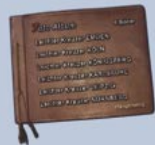
Foto Album mit themenbezogenen Abbildungen