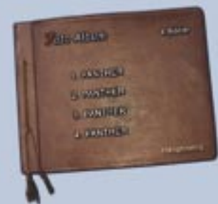
Foto Album mit themenbezogenen Abbildungen