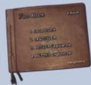
Foto Album mit themenbezogenen Abbildungen