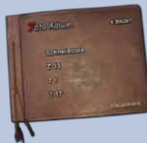
Foto Album mit themenbezogenen Abbildungen