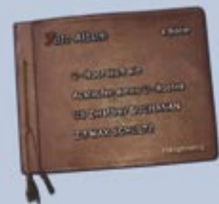
Foto Album mit themenbezogenen Abbildungen