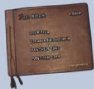
Foto Album mit themenbezogenen Abbildungen